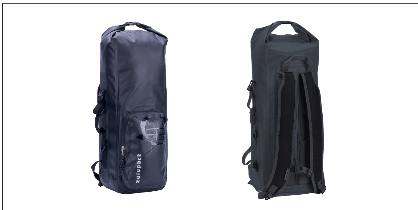
Sac Zulupack Nomad 25 Noir