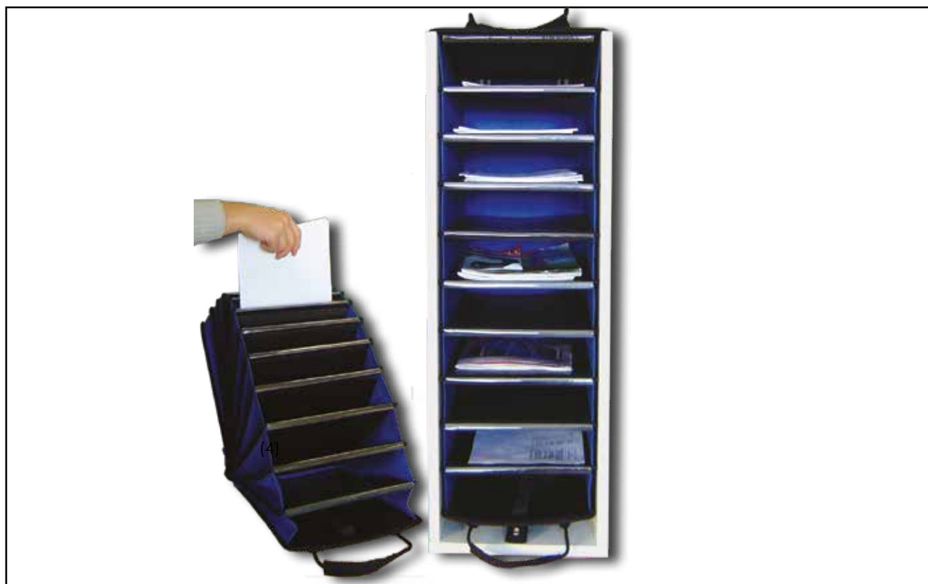
TN283880, CEP, 10C