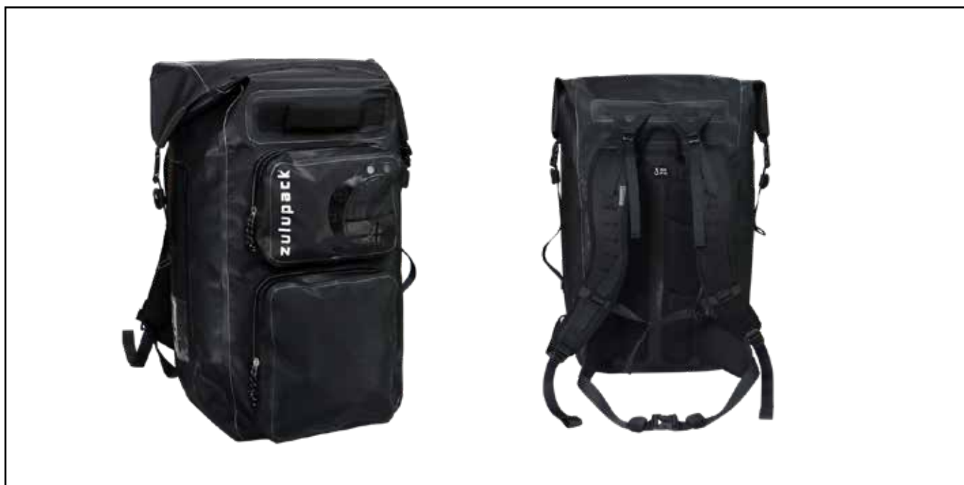
Sac Zulupack Nomad 60 Noir