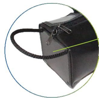
Renforts latéraux avec trous d'évacuation et anse en cordelette