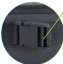
Fermeur des sangles d'attaches